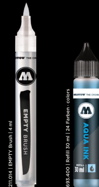
211.014 | EMPTY Brush | 4 ml