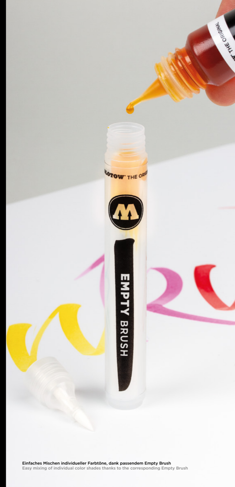
Einfaches Mischen individueller Farbtöne, dank passendem Empty Brush Easy mixing of individual color shades thanks to the corresponding Empty Brush